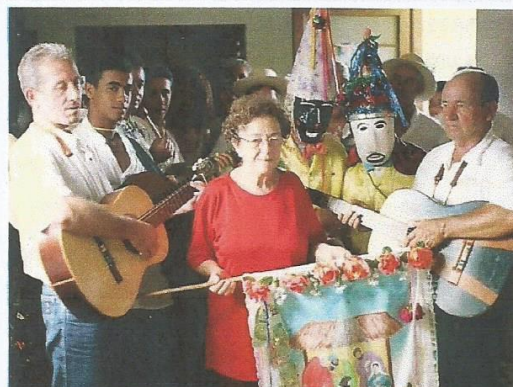
Foto 2: Festeiro da Folia no momento da troca das bandeiras. Data e fotógrafo desconhecidos