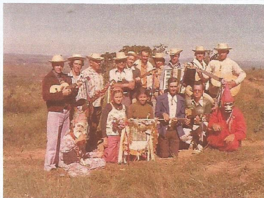
Foto 1: Foliões da Folia. Data: janeiro/1977.