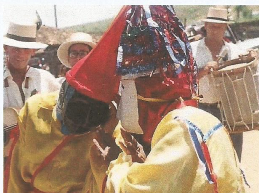
Foto 3: Palhaços, personagens da Folia. Data e fotógrafos desconhecidos